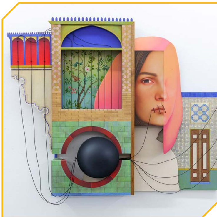
دو نمونه از آثار خسروی

او هست که نقش زنانه در آن نباشد و یا این نقش کمرنگ باشد. علاوه بر این، خسروی از عناصر معماری ایرانی نیز به‌خوبی برای ایجاد ترکیب‌بندی‌های جدید بهره می‌گیرد و گریز عامدانه از ترکیب‌بندی‌های کلاسیک هنر اروپا و حتی ایران در آثار او مشاهده می‌شود. در نهایت، همان‌طور که گفته شد، او به این ساختار شکنی بسنده نمی‌کند و از قالب دوبعدی بوم بیرون می‌آید و ترکیب‌هایی را ارائه می‌دهد که در فضای بینابین نقاشی و حجم قرار می‌گیرند.