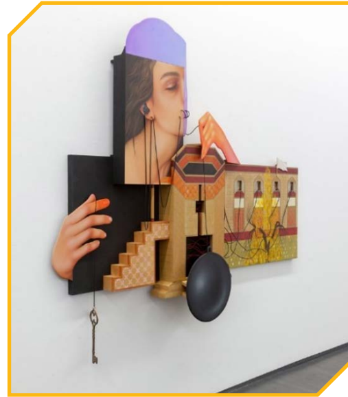
نمایی از اثر سه بعدی‌ای از آثار خسروی

از دیدگاه فرمیک، در بسیاری از آثار او می‌توان عناصری مانند بمب، موشک و مواردی از این دست را در برابر لطافت زنانه مشاهده کرد. در استفاده از پالت‌های رنگی نیز آنجا که به معماری ایران مرتبط می‌شود، رنگ‌های خاکستری‌ای را که به واقعیت معماری ایرانی نزدیکند، برمی‌گزیند. در مقابل، از پس‌زمینه‌هایی که نقش زن را هویدا می‌کند، بهره می‌برد و حتی در بسیاری موارد در پوشش زنان، از رنگ‌هایی با درخشندگی بالا به منظور ایجاد جذابیت بصری برای مخاطب استفاده می‌کند. می‌توان گفت آثار خسروی به‌راحتی در دسته‌بندی‌های موجود قرار نمی‌گیرند. با این حال، ویژگی‌های سوررئالیستی و سمبلیستی در ترکیب با هنر ایرانی، هم‌زمان در آثار او مشاهده می‌شود.