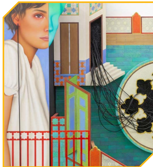
به کارگیری عناصر زنانه و نگارگری ایرانی و نماد به صورت هم‌زمان در یک ترکیب‌بندی جدید

زن قرار گرفته و همچنین میله‌هایی که بیشبابت به میله‌های زندان نیستند و نیز کلافی تیره‌رنگ که به دستها پیچیده شده است، مواجهیم. در تارنمای شخصی او در این باره آمده است: «نقوش بصری مانند ستون‌های سیاه، موشک‌ها و قفس‌ها به سیستم‌های اقتصادی و سیاسی فاسد اشاره می‌کنند؛ در حالی که بدن زنان اغلب به صورت غل و زنجیر شده یا با دهان بسته به تصویر کشیده می‌شود» ( https://b2n.ir/g94482 ). برای نمونه، در تصویر زیر شاهد نوعی بیان سمبلیک از زنی هستیم که چشم او با پارچه‌های سفیدرنگ بسته شده و بر فراز پنجره‌های مزین به طاق ایرانی نیز پرچم سفید رنگی افراشته شده است. در این میان، زبانه‌های آتش از پایین اثر به بالا سرایت می‌کند و بیم آن هست که شعله‌ها زن را به‌رغم پرچم صلح فرا بگیرد.